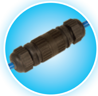
Conexión rápida en línea