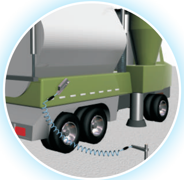
Relier un camion aspirateur à une tige de mise à la terre.

Le Bond-Rite EZ est particulièrement utile en cas de situations nécessitant une mise à la terre provisoire ou d'urgence dans les endroits où il n'est pas pratique de se raccorder à un système de mise à la terre permanent ou lorsque les directives ou procédures de sécurité requièrent que les connexions à la terre soient testées et vérifiées.