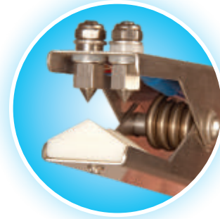
Extrémités en carbure de tungstène