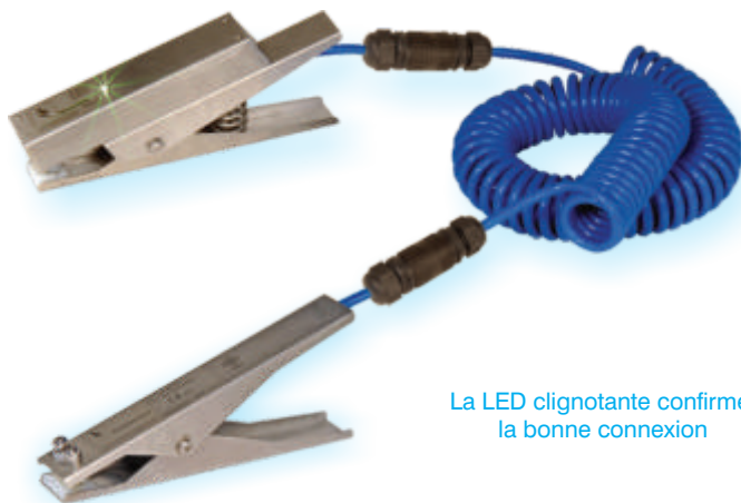
La LED clignotante confirme la bonne connexion